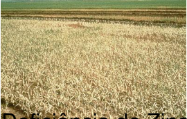
Deficiência de Zinco