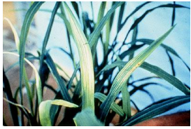
Deficiência de Manganês